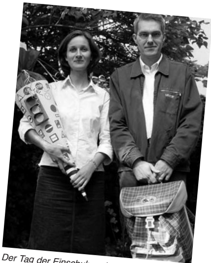
Der Tag der Einschulung ist gekommen ...

Mit Beginn der Schulzeit sollte Ihr Kind einen ungestörten Arbeitsplatz haben; das muss kein eigenes Zimmer sein. Er sollte dem Kind ermöglichen, seine Hausaufgaben regelmäßig, zu einer bestimmten Zeit und ohne Ablenkung zu erledigen. Tisch und Stuhl sollen der Größe des Kindes entsprechen. Tages- oder Lampenlicht soll für Rechtshänder von links, für Linkshänder von rechts einfallen. Für manche Kinder ist es wichtig, bei den Hausaufgaben in der Nähe der Eltern zu sein. Möglicherweise gibt ihnen das die benötigte Sicherheit. Lassen Sie es dennoch selbstständig arbeiten.